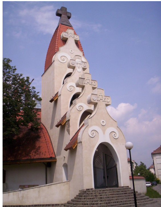
Csíkszeredai katolikus templom

Túlnyomórészt közösségi, gyakran szakrális tereket épített. Makovecz Imre magas szintű közösségi igényét tanúsítja. "Műhelyteremtő egyéniség", aki "rendkívüli közösségi feladatokat" vállalt fel, a Vándoriskolával, a Kós Károly Egyesüléssel, a határon túli kapcsolatokkal és a Magyar Művészeti Akadémia megalapításával.