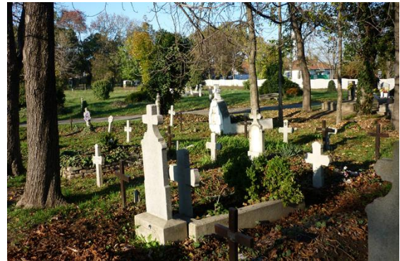
A kiskunhalasi temető első világháborús sírjai

szok, Kissek, Kolompárok, Kovácsok, Lászlók, Modokok, Molnárok, Nagypálok, Némethék, Orbánok, Paor-Schmolczok, Papok, Paprikák, Sándorok, Szabók, Tallérok, Takácsok, Tóth Abonyik, Vargák, Vácziak, Vánok (és még sorolhatnánk hosszasan) veszítették el szeretteiket. Halottaink neveit út menti keresztekre, települési-, egyházi- és iskolai emlékművekre vésték fel a városban és a külterületen. Kiskunhalason a református gimnáziumban, a zsinagógában, illetve a Hősök terén láthatóak ezek az emlékhelyek. Sajnos, sem a korszakban, sem mostanra nem sikerült a neveiket teljesen felderíteni, illetve pontosítani. Már az 1920-as években többen felhívták rá a figyelmet, hogy nem mindenki szerepel a halotti lajstromokon, vagy, hogy hibásak a listák.