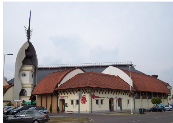
Eger: Bitskey Aladár uszoda (2007)

Makovetz Imre bebizonyította, hogy a közhasznú építési tevékenység folyamatában az építők és a használók egyetlen rítus szereplői lehetnek. Így számos faluház önerejű létrehozása már az építés alatt ma-