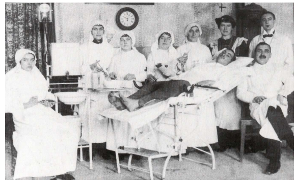
Kiskunhalasi kórház a háború idején

Az 1914. július 26-án elrendelt részleges mozgósítást már igencsak megérezte a város. Ősszel még díszzászlót küldtünk a német császárnak, ám hamarosan polgárőrséget kellett szervezni, mert a rendet egyre nehezebb volt fenntartani. Kiskunhalas vasúti csomópont volt, így a katonaság szinte állandóan jelen volt a városban. Budapest felől a Balkán-félsziget felé innen volt a leggyorsabb az útja minden szerelvénynek, de sínpár vitt a településről Bajára, Kiskunfélegyházára és részben Szegedre és Zomborba is.